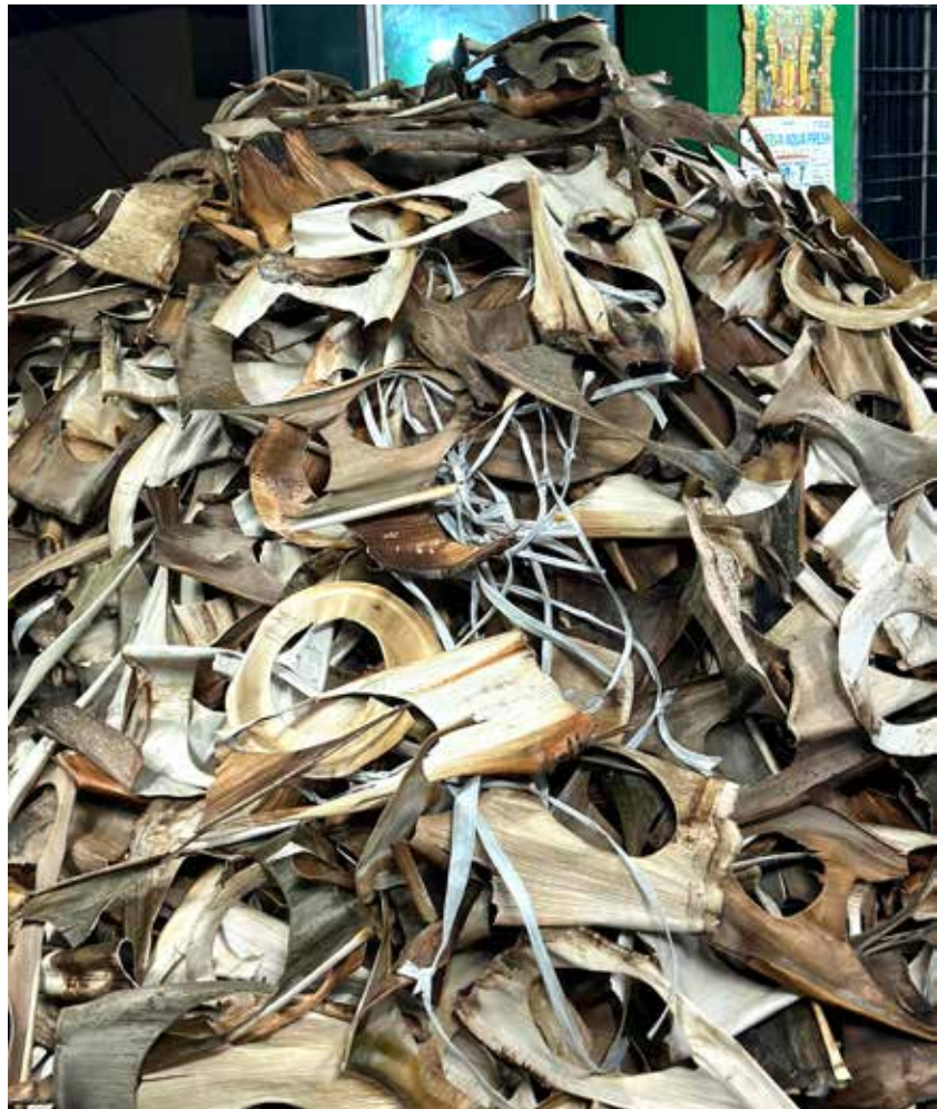
Indien minskar engångsartiklar genom att tillverka miljövänliga alternativ av pressade löv.