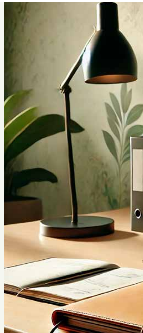
Bilden är ett AI-collage.

familj på fyra personer" och få förslag på recept med tillhörande inköpslista. Be ChatGPT sortera listan efter din lokala butiks upplägg, som exempelvis ICA Maxi, där avdelningarna matchar hur butiken är organiserad (grönsaker, mejeri, kött och bröd).