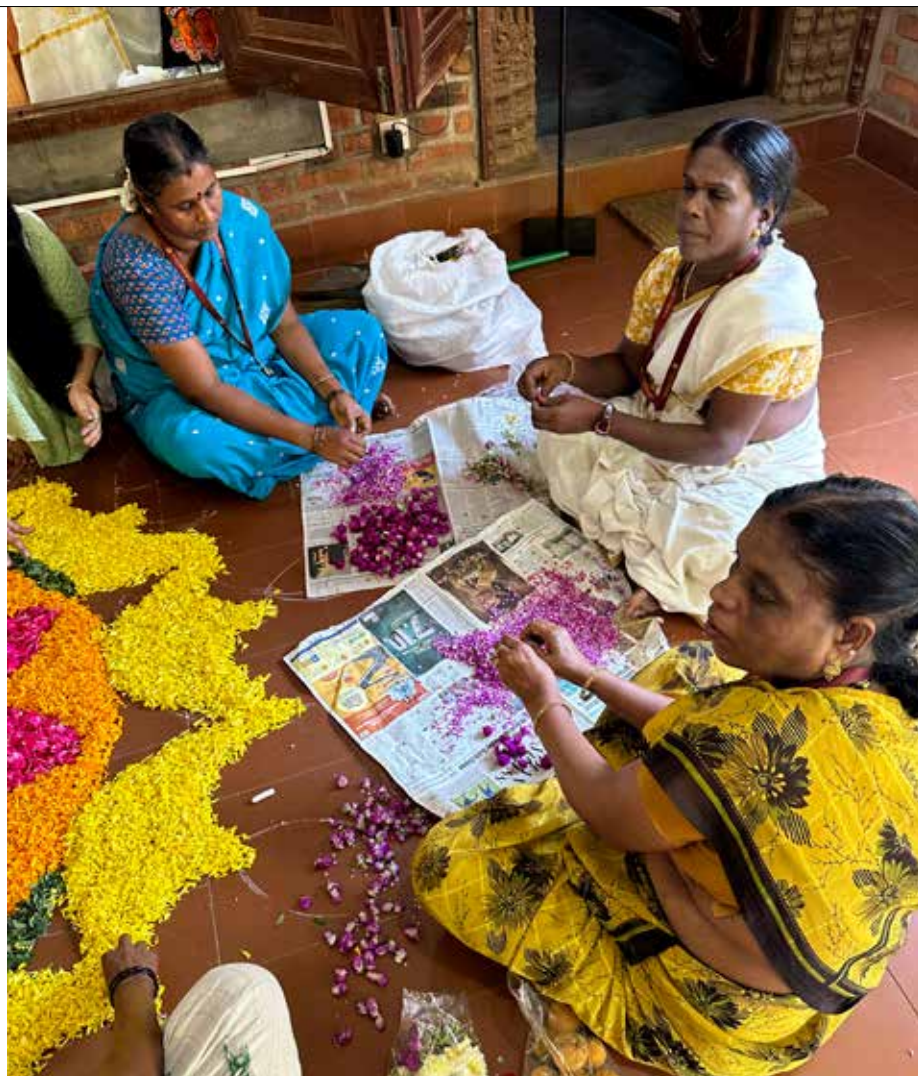
Kvinnor skapar vackra blomsterarrangemang med tekniken Pookalam, en traditionell konstform där färskva blommor används för att skapa färgstarka mönster.

När du reser inom Indien är flexibilitet viktigt. Det är klokt att växla pengar vid ankomst till flygplatsen, där växelkursen ofta är bättre än i Sverige. Även om större hotell och butiker accepterar kort, behövs kon-