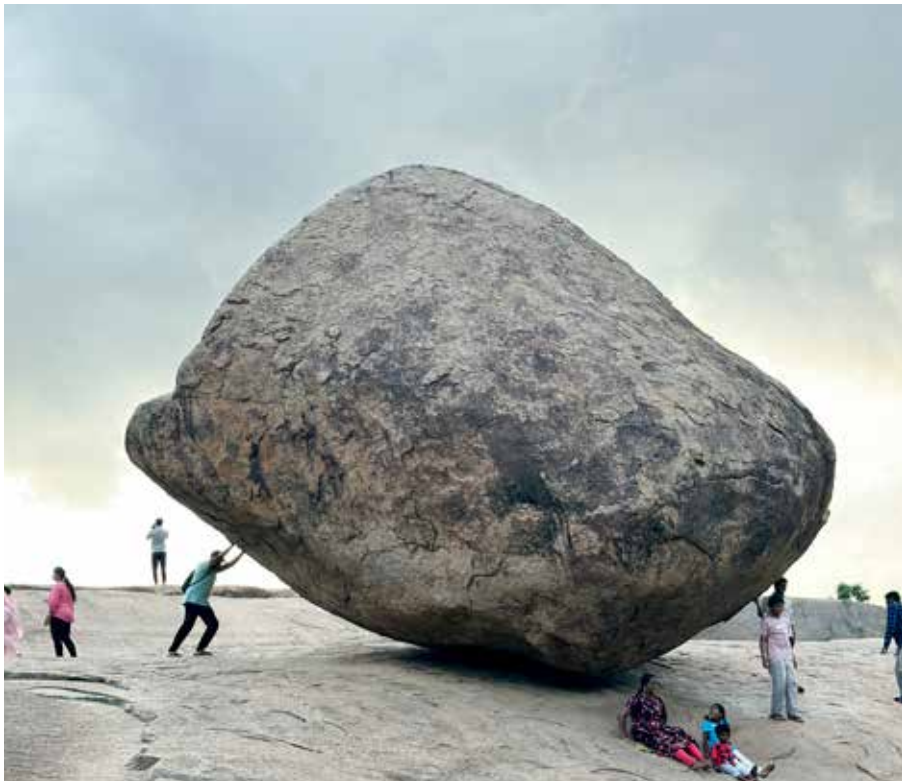
Besökare samlas vid den berömda Balancing Rock, ett imponerande naturfenomen som fascinerar med sin balans och storlek

Alkohol är tillåtet, men omges av sociala regler. Det är vanligt att män undviker att dricka inför kvinnor, och alkohol konsumeras sällan i närvaro av barn. Droger är sällsynta, och rökning anses socialt oacceptabelt i många kretsar.