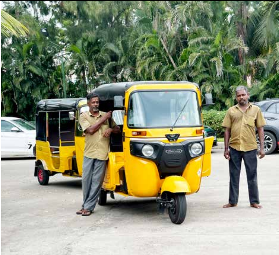
En klassisk auto-rickshaw, ofta kallad "tuk-tuk", är ett populärt och smidigt transportmedel i Indiens stadsmiljö.