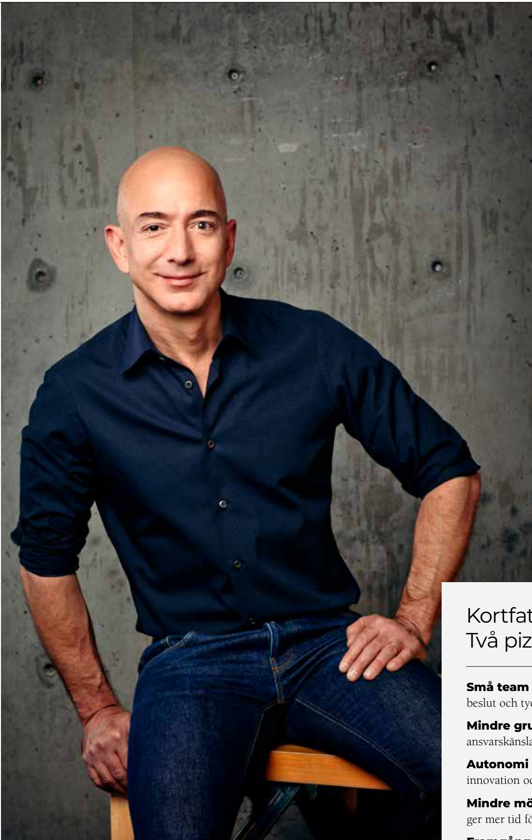
Jeff Bezos, grundaren av Amazon, använde en enkel princip för att bygga ett av världens mest framgångsrika företag.